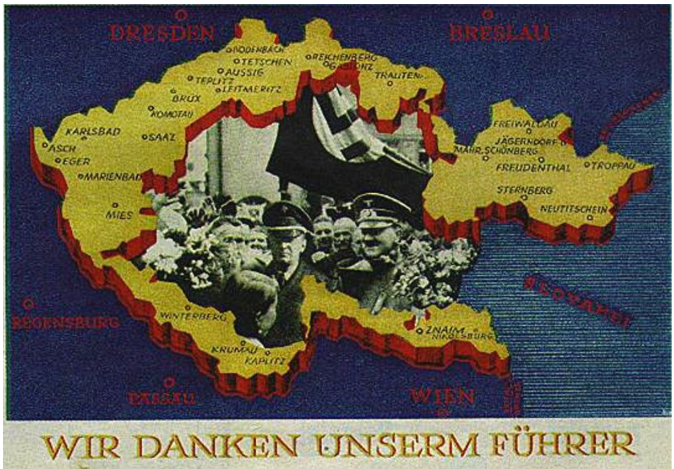
Zdroje: Propagační tisk Kolínské cikorky z roku 1938 a dobová pohlednice, http://www.moderni-dejiny.cz/clanek/mnichov-1938/