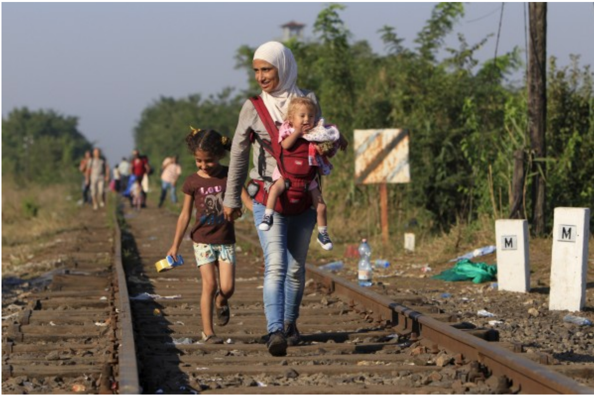
Uprchlíci v Maďarsku (fotografie č. 2)