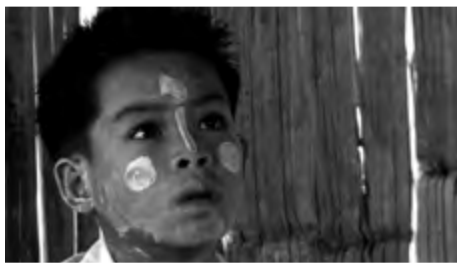
SEIN LYAN TUN / BARMA / 2015 / 12 MIN.