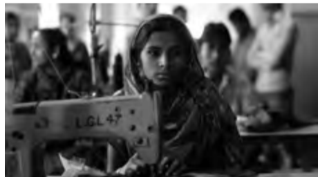
J. KILMI & L. LABERENZ / ESTONSKO / 2015 / 59 MIN. / 14+

TÉMA FILMU: ENVIRONMENTÁLNÍ CHOVÁNÍ, CHUDOBA PRŮŘEZOVÁ TÉMATA: ENVIRONMENTÁLNÍ VÝCHOVA, VÝCHOVA K MYŠLENÍ V EVROPSKÝCH A GLOBÁLNÍCH SOUVISLOSTECH, OSOBNOSTNÍ A SOCIÁLNÍ VÝCHOVA