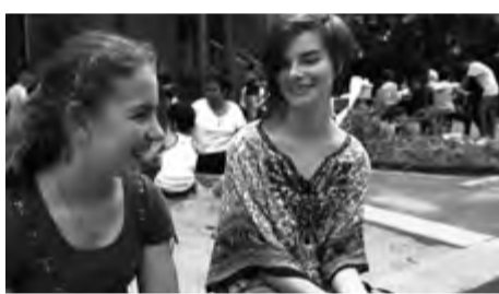
PHILLIS FERMER / NĚMECKO / 2014 / 15 MIN.