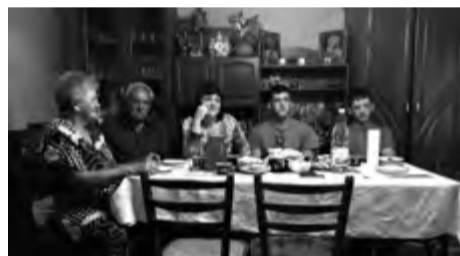
FILIP REMUNDA / ČESKÁ REPUBLIKA / 2015 / 68 MIN. / 14+

TÉMA FILMU: KRIZOVÉ OBLASTI, VÁLEČNÉ KONFLIKTY, UKRAJINA, SOUČASNÁ RUSKÁ PROPAGANDA PRŮŘEZOVÁ TÉMATA: VÝCHOVA K MYŠLENÍ V EVROPSKÝCH A GLOBÁLNÍCH SOUVISLOSTECH, OSOBNOSTNÍ A SOCIÁLNÍ VÝCHOVA