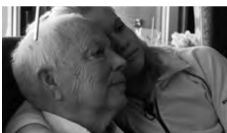
ERLEND E. MO / 2015 / NORSKO, DÁNSKO, ŠVÉDSKO / 29 MIN.