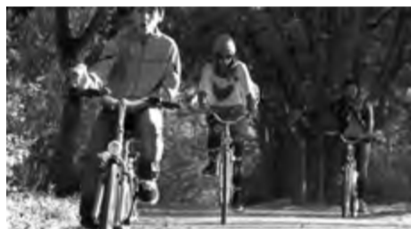
REUCKER CAROLINE / NĚMECKO / 2015 / 55 MIN. / 15+

TÉMA FILMU: KRIZOVÉ OBLASTI, VÁLEČNÉ KONFLIKTY, MIGRACE, RODINA PRŮŘEZOVÁ TÉMATA: MULTIKULTURNÍ VÝCHOVA, VÝCHOVA K MYŠLENÍ V EVROPSKÝCH A GLOBÁLNÍCH SOUVISLOSTECH, OSOBNOSTNÍ A SOCIÁLNÍ VÝCHOVA