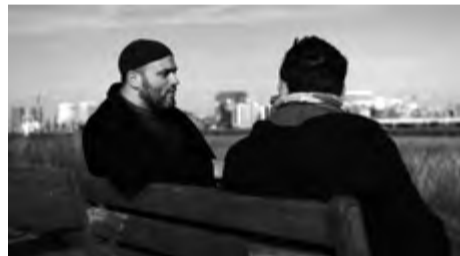
MARK DE VISSCHER / BELGIE / 2015 / 52 MIN. / 15+

TÉMA FILMU: NÁBOŽENSTVÍ, KRIZOVÉ OBLASTI, VÁLEČNÝ KONFLIKT, MIGRACE PRŮŘEZOVÁ TÉMATA: MULTIKULTURNÍ VÝCHOVA, VÝCHOVA K MYŠLENÍ V EVROPSKÝCH A GLOBÁLNÍCH SOUVISLOSTECH, OSOBNOSTNÍ A SOCIÁLNÍ VÝCHOVA