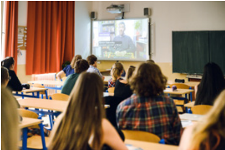
Gymnázium Jana Patočky, Praha