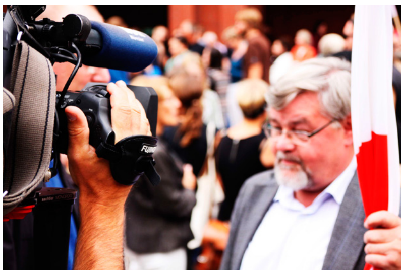
Média jako součást politického života

Takže když tu a tam zaznívá volání po klidu, po pozitivnějších médiích apod., je třeba být na pozoru. Jak se říká: Klidu si dost užijeme po smrti, tak proč spěchat?