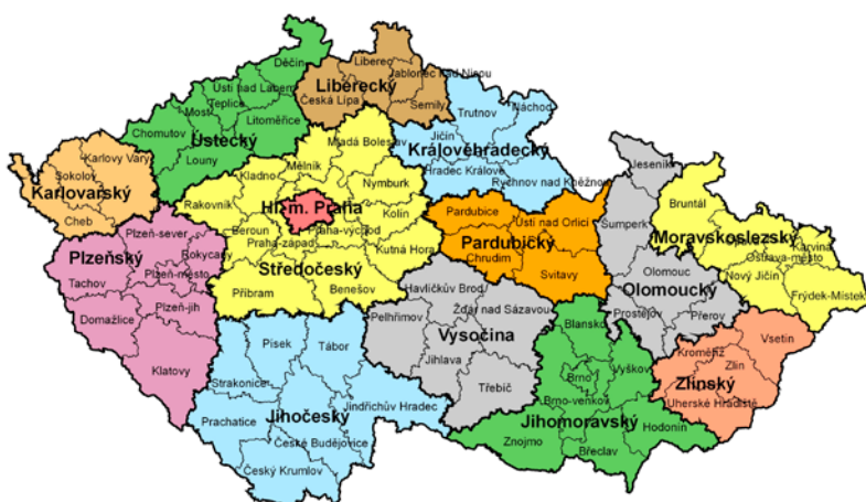
Mapa krajů České republiky

Stejně jako u obcí i v krajích ze zastupitelstva vznikne krajská rada, ta si pak volí představitele kraje – hejtmána. Rady krajů vznikají na základě politických dohod zvolených stran. Zastupitelstva krajů mohou rovněž předkládat návrhy zákonů Poslanecké sněmovně Parlamentu ČR.