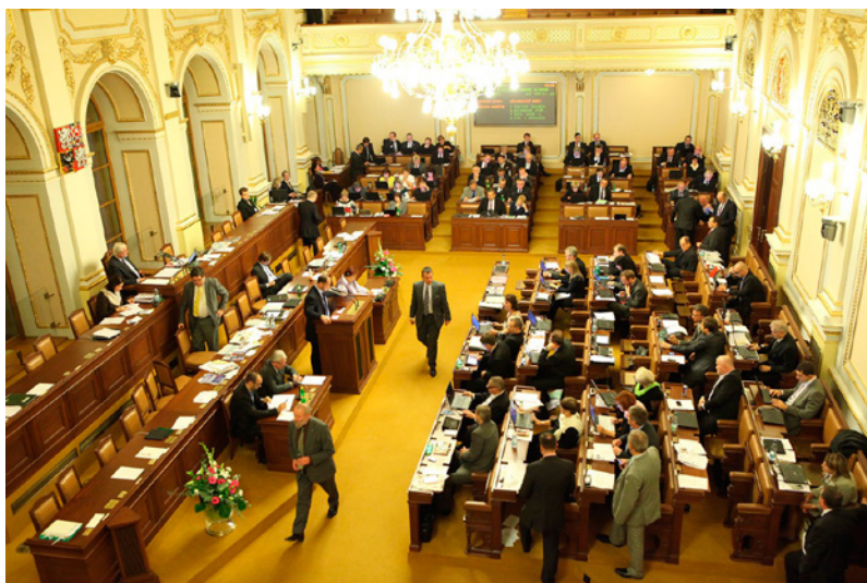
Zasedání poslanecké sněmovny Parlamentu České republiky

Největší politický vliv na utváření podoby české společnosti má Poslanecká sněmovna Parlamentu ČR, která přijímá zákony, vyslovuje důvěru vládě, může také zřizovat vyšetřovací komise a volí členy mediálních rad.