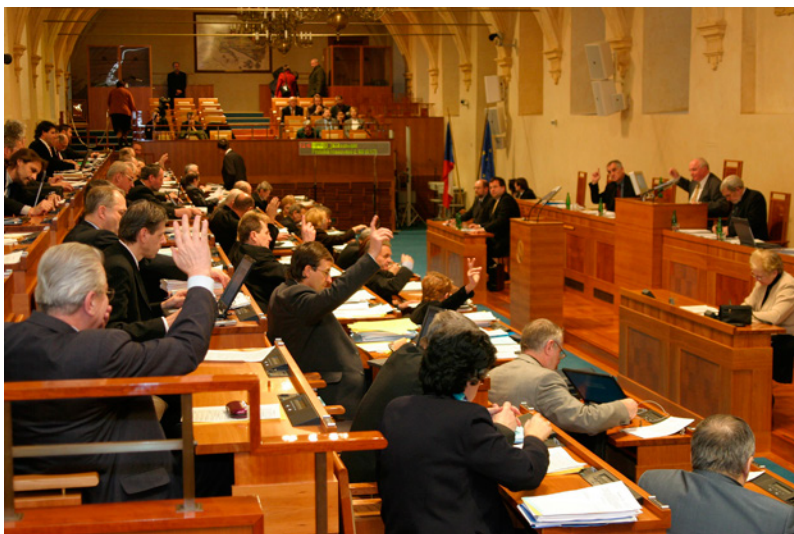
Zasedání Senátu Parlamentu České republiky

Senát má i specifické pravomoci, kterými nedisponuje sněmovna.