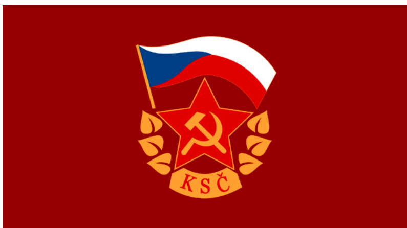
Symbol KSČ před listopadem 1989

Po sovětské okupaci v srpnu 1968 a následném utužení komunistického režimu byl na začátku normalizace přijat ústavní zákon, který umožnil „očistit“ parlament od příliš demokraticky smýšlejících poslanců a prodloužil volební období tak, aby se volby nemusely konat v době, kdy komunisté ještě neměli situaci zcela pod kontrolou. Jak ukazují výsledky tehdejších voleb, záměr vyšel dobře. V roce 1971 byli zvoleni všichni kandidáti tak, jak byli navrženi, jejich podpora byla přes 99 % hlasů. Podobné výsledky byly i v dalších letech. Ve všech volbách se užíval stejný systém, země byla rozdělena do jednomandátových obvodů, v každém obvodu kandidoval jeden kandidát. Poměr poslanců, kteří připadli na jednotlivé politické strany, byl stanoven předem.