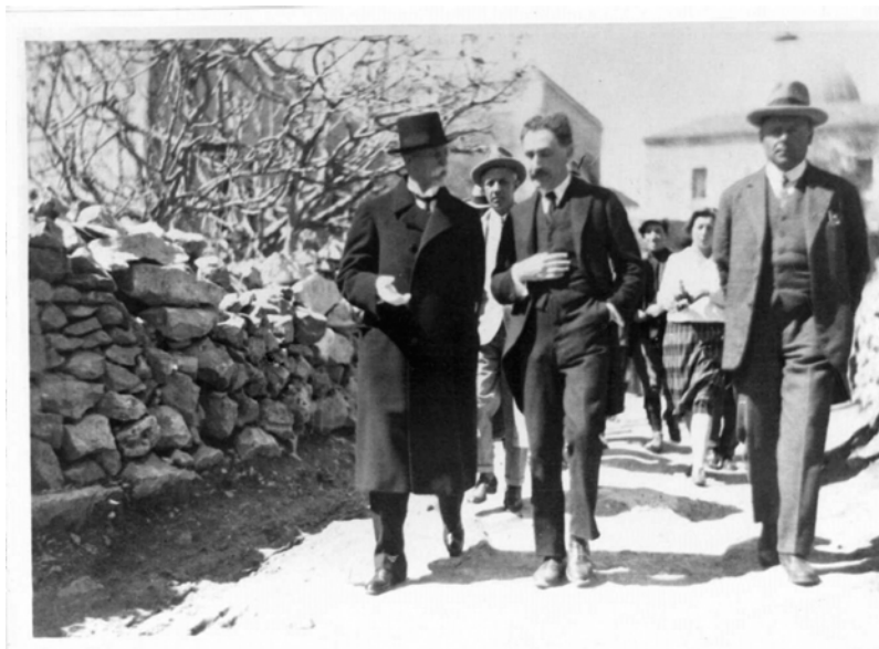
První československý prezident Tomáš Garrigue Masaryk na zahraniční cestě v Izraeli

Zatímco následující volby (v říjnu 1929) znamenaly ustálení stranické struktury, ty poslední v prvorepublikové éře přinesly překvapení: zvítězila sudetoněmecká strana SdP. Zástupci německé menšiny tak v roce 1935 získali celkem 44 mandátů v Poslanecké sněmovně.