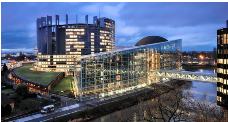
Budova Evropského parlamentu ve Štrasburku

Evropský parlament (EP) je jedním ze stálých orgánů Evropské unie (EU). Reprezentuje zájmy občanů EU, kteří volí jeho členy v přímých volbách. Je tak orgánem, který v institucionálním rámci EU představuje základní demokratický prvek. Evropský parlament své aktivity vykonává zejména v Bruselu, ale také ve Štrasburku a v Lucemburku.