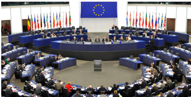
Zasedací sál Evropského parlamentu ve Štrasburku

Česká republika se poprvé evropských voleb zúčastnila v červnu 2004, krátce po svém vstupu do Evropské unie. Volby do Evropského parlamentu zde probíhají v souladu s volební tradicí v pátek a v sobotu. Na rozdíl od voleb do Poslanecké sněmovny Parlamentu ČR tvoří Česká republika pro evropské volby jeden volební obvod. To znamená, že strany sestavují jednu kandidátku pro celou Českou republiku. Právo volit má každý, kdo dosáhl věku 18 let. Právo být volen je přiznáno občanům po dosažení věku 21 let. Voleb do Evropského parlamentu se v České republice mohou účastnit také občané jiných členských států EU v případě, že v den konání voleb dosáhli minimální hranice 45 dnů přihlášení k trvalému nebo přechodnému pobytu v ČR.