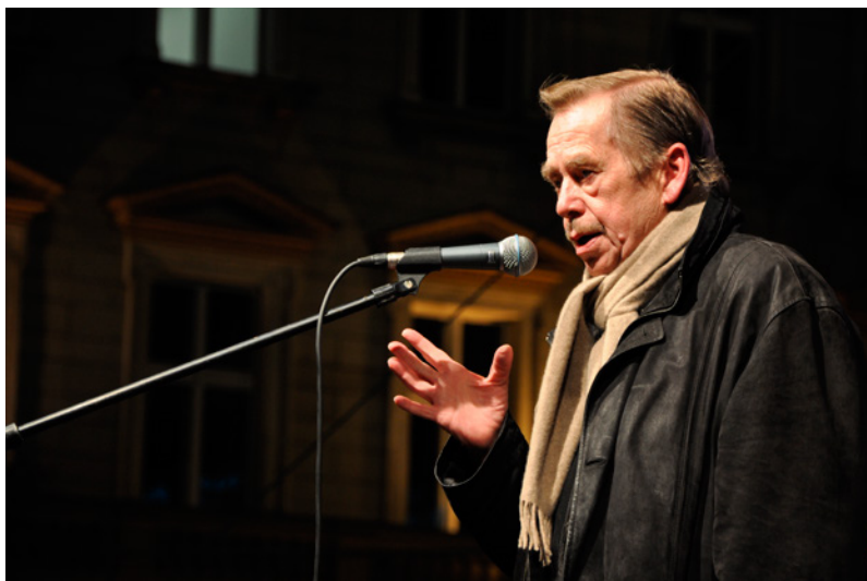
Prezident Václav Havel během oslav výročí 17. listopadu v roce 2009

Prezidentské kandidáty může navrhnout skupina nejméně 20 poslanců nebo 10 senátorů. Stejně právo mají i plnoletí občané, kteří také mohou navrhnout kandidáty. Jejich návrh ale musí podpořit petice s nejméně 50 tisíci podpisy. Volit pak může v tajné volbě každý občan starší 18 let. Pokud některý kandidát získá už v prvním kole nadpoloviční většinu hlasů, vítězí. Pakliže ale nikdo takový počet hlasů nezíská, musí se do 14 dnů konat druhé kolo volby, do kterého postoupí dva nejúspěšnější kandidáti. Prezidentem se stává ten, který získá více hlasů.