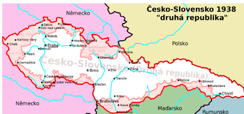
Mapa Československé republiky po roce 1938