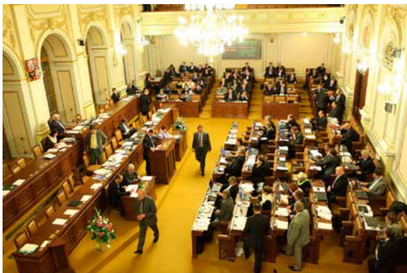
Zasedání poslanecké sněmovny Parlamentu České republiky

Největší politický vliv na utváření podoby české společnosti má Poslanecká sněmovna Parlamentu ČR, která přijímá zákony, vyslovuje důvěru vládě, může také zřizovat vyšetřovací komise a volí členy mediálních rad.