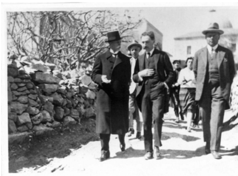
První československý prezident Tomáš Garrigue Masaryk na zahraniční cestě v Izraeli

Zatímco následující volby (v říjnu 1929) znamenaly ustálení stranické struktury, ty poslední v prvorepublikové éře přinesly překvapení: zvítězila sudetoněmecká strana SdP. Zástupci německé menšiny tak v roce 1935 získali celkem 44 mandátů v Poslanecké sněmovně.