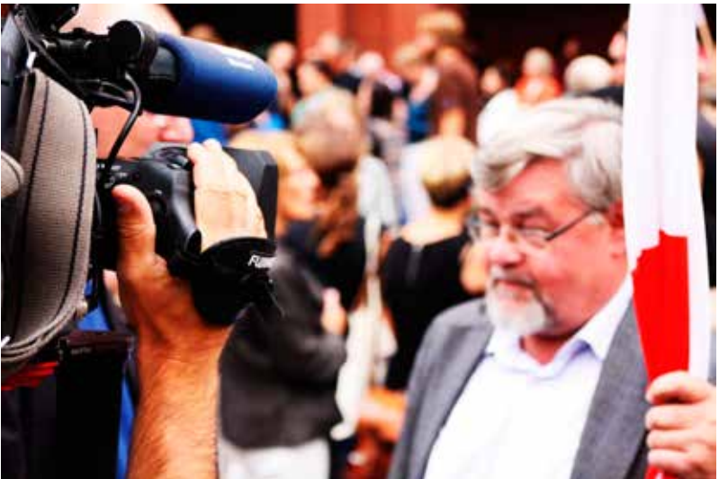
Média jako součást politického života

Takže když tu a tam zaznívá volání po klidu, po pozitivnějších médiích apod., je třeba být na pozoru. Jak se říká: Klidu si dost užijeme po smrti, tak proč spěchat?