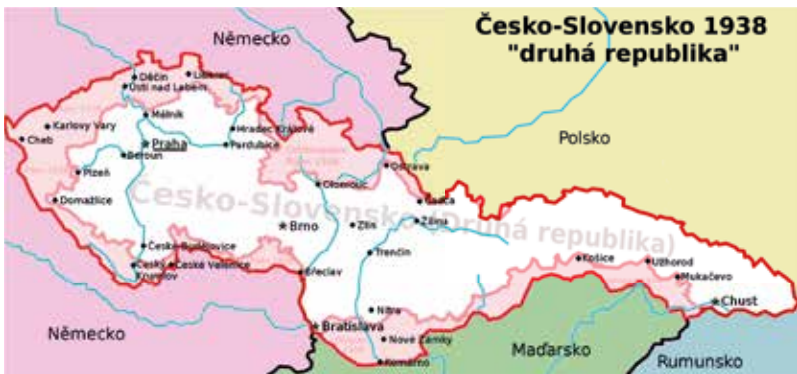
Mapa Československé republiky po roce 1938