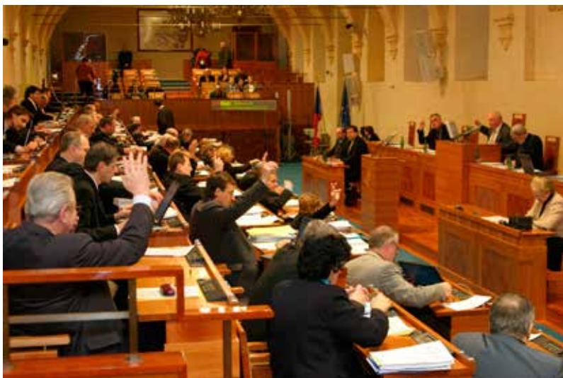
Zasedání Senátu Parlamentu České republiky

Senát má i specifické pravomoci, kterými nedisponuje sněmovna.