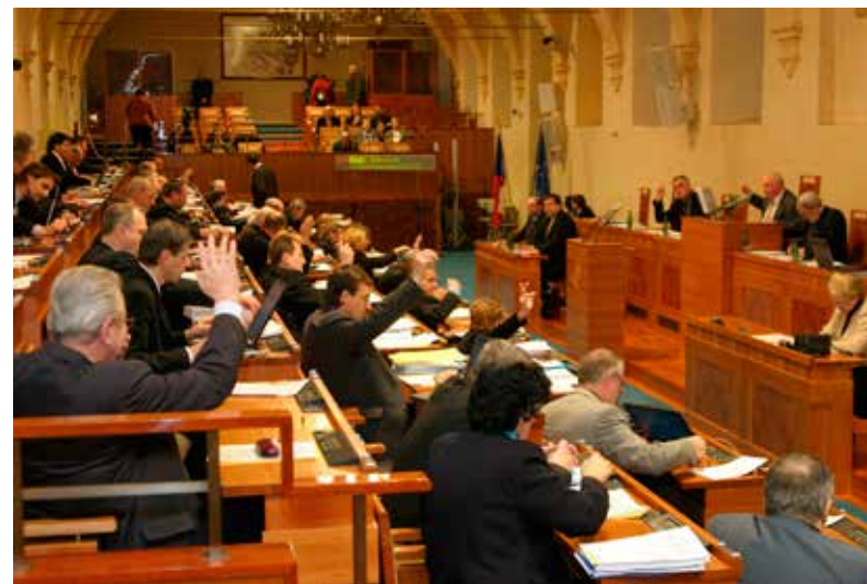
Zasedání Senátu Parlamentu České republiky

Senát je přesto slabší komorou než sněmovna. Například nehlasuje o důvěře vládě či o státním rozpočtu. Když Senát zamítne nějaký návrh, který přišel ze sněmovny, mohou ho poslanci většinou svých hlasů (zapotřebí je tedy 101 poslanců) přehlasovat. Nepřehlasovatelný je Senát při projednávání ústavních zákonů nebo například při změnách volebních pravidel.