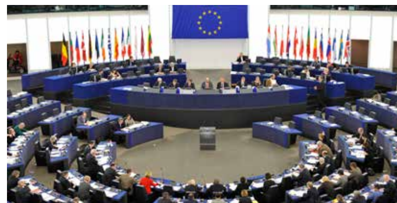
Zasedací sál Evropského parlamentu ve Štrasburku

Česká republika se poprvé evropských voleb zúčastnila v červnu 2004, krátce po svém vstupu do Evropské unie. Volby do Evropského parlamentu zde probíhají v souladu s volební tradicí v pátek a v sobotu. Na rozdíl od voleb do Poslanecké sněmovny Parlamentu ČR tvoří Česká republika pro evropské volby jeden volební obvod. To znamená, že strany sestavují jednu kandidátku pro celou Českou republiku. Právo volit má každý, kdo dosáhl věku 18 let. Právo být volen je přiznáno občanům po dosažení věku 21 let. Voleb do Evropského parlamentu se v České republice mohou účastnit také občané jiných členských států EU v případě, že v den voleb dosáhli minimální hranice 45 dnů přihlášení k trvalému nebo přechodnému pobytu v ČR.