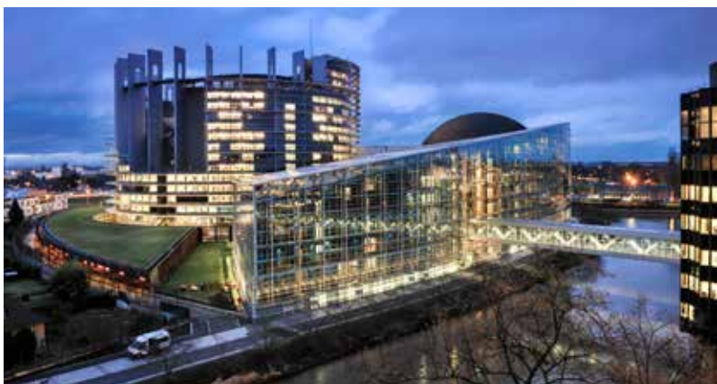
Budova Evropského parlamentu ve Štrasburku

Evropský parlament (EP) je jedním ze stálých orgánů Evropské unie (EU). Reprezentuje zájmy občanů EU, kteří volí jeho členy v přímých volbách. Je tak orgánem, který v institucionálním rámci EU představuje základní demokratický prvek. Evropský parlament své aktivity vykonává zejména v Bruselu, ale také ve Štrasburku a v Lucemburku.