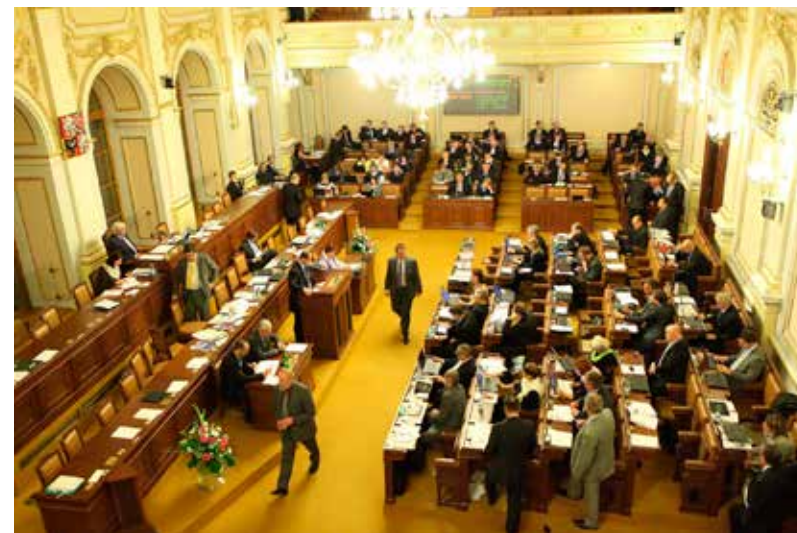
Zasedání Poslanecké sněmovny Parlamentu České republiky

Největší politický vliv na utváření podoby české společnosti má Poslanecká sněmovna Parlamentu ČR, která přijímá zákony, vyslovuje důvěru vládě, může také zřízovat vyšetřovací komise a volí členy mediálních rad.