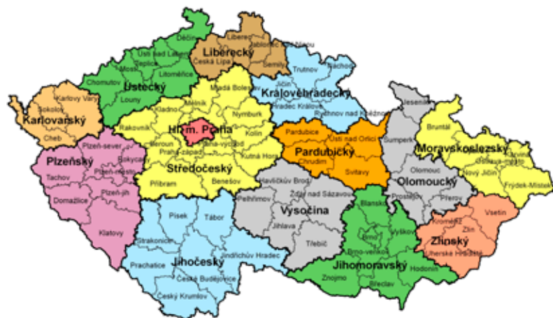
Mapa krajů České republiky

Stejně jako u obcí i v krajích ze zastupitelstva vznikne krajská rada, ta si pak volí představitele kraje – hejtmana. Rady krajů vznikají na základě politických dohod zvolených stran. Zastupitelstva krajů mohou rovněž předkládat návrhy zákonů Poslanecké sněmovně Parlamentu ČR.