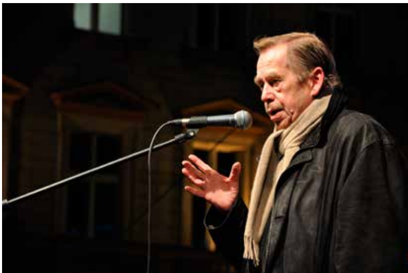
Prezident Václav Havel během oslav výročí 17. listopadu v roce 2009

Prezidentské kandidáty může navrhnout skupina nejméně 20 poslanců nebo 10 senátorů. Stejně právo mají i plnoletí občané, kteří také mohou navrhnout kandidáty. Jejich návrh ale musí podpořit petice s nejméně 50 tisíci podpisy. Volit pak může v tajné volbě každý občan starší 18 let. Pokud některý kandidát získá už v prvním kole nadpoloviční většinu hlasů, vítězí. Pakliže ale nikdo takový počet hlasů nezíská, musí se do 14 dnů konat druhé kolo volby, do kterého postoupí dva nejuspěšnější kandidáti. Prezidentem se stává ten, který získá více hlasů.