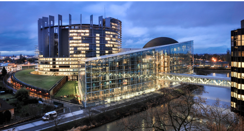
Budova Evropského parlamentu ve Štrasburku

Evropský parlament (EP) je jedním ze stálých orgánů Evropské unie (EU). Reprezentuje zájmy občanů EU, kteří volí jeho členy v přímých volbách. Je tak orgánem, který v institucionálním rámci EU představuje základní demokratický prvek. Evropský parlament své aktivity vykonává zejména v Bruselu, ale také ve Štrasburku a v Lucemburku.